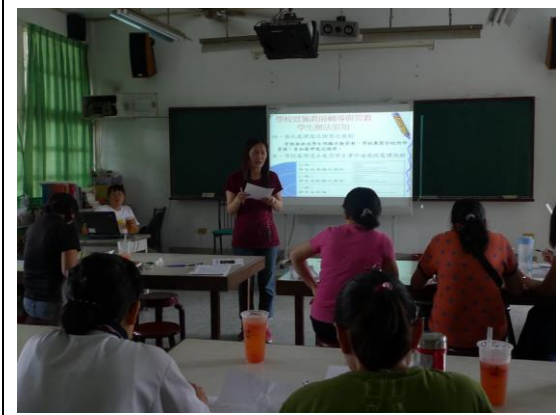
介紹「教師與輔導學生管教辦法」