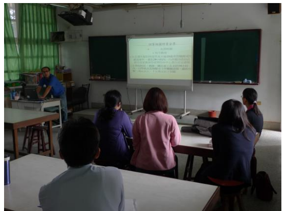
介紹「性別平等教育法」