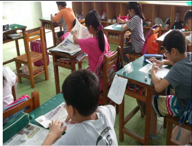
說明：運用晨讀時間閱報