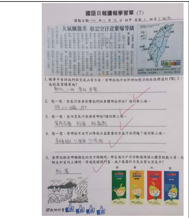
說明：學生剪報作品