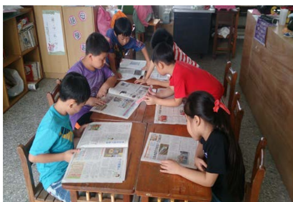
說明：學生共同閱讀報紙