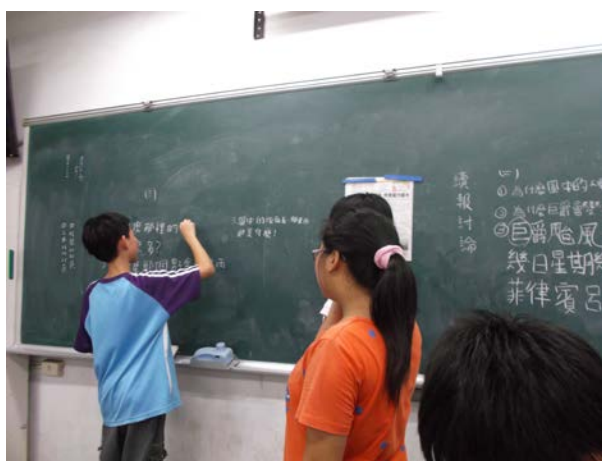
說明：全班進行讀報討論