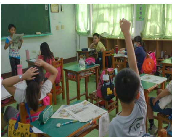
說明：學生閱報後提問討論