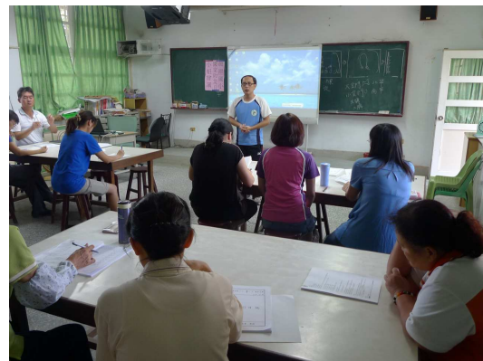
校務會議各處室報告及提案討論