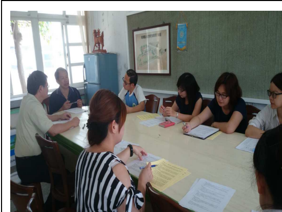
期初期末召開校務會議