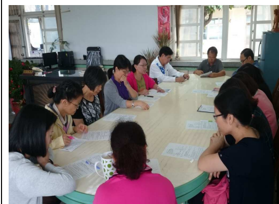
期初期末召開校務會議