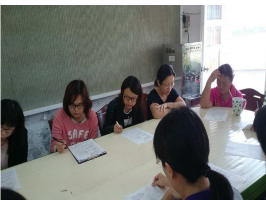
校務會議各處室報告及提案討論