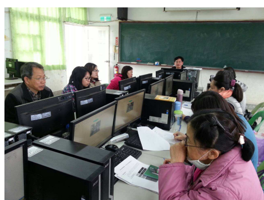
晨會進行重要事項溝通與討論