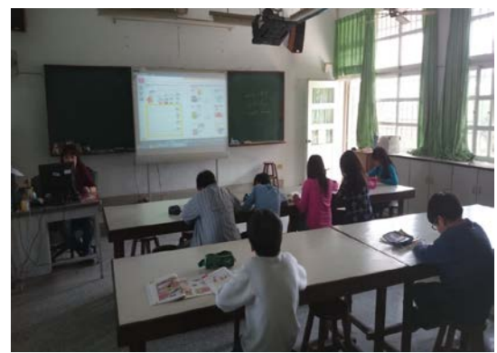
電子白板、單槍多元電子化設備