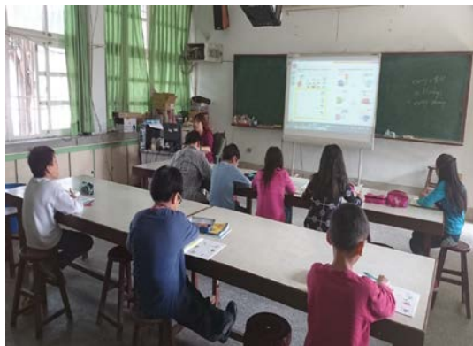
電子白板、單槍多元電子化設備