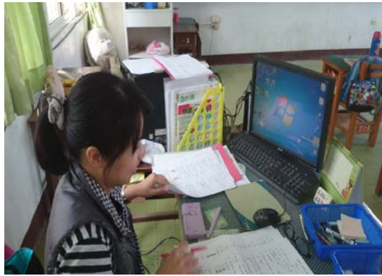
班班建置多元軟硬體E化設備