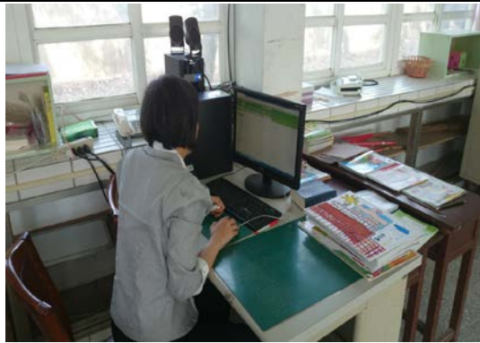
班班建置多元軟硬體E化設備