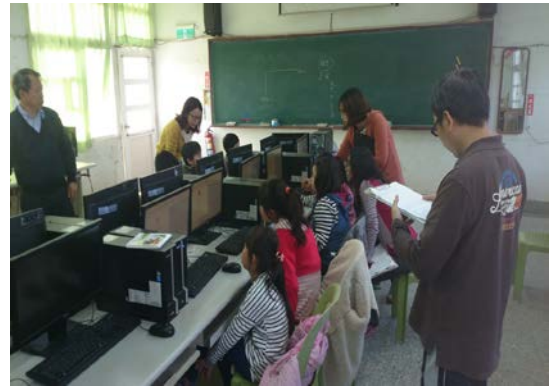
網路系統與電腦教室